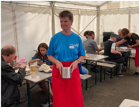
Freiwillige im Einsatz