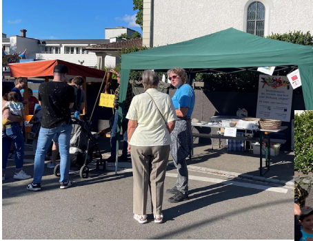
Unser Stand an der Chilbi